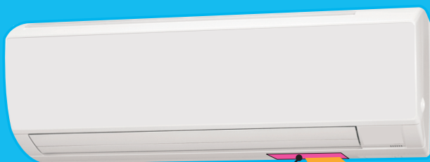
機種名・製造番号・製造年の表示シール