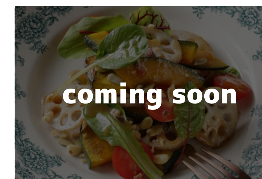
カラフル焼き野菜サラダ