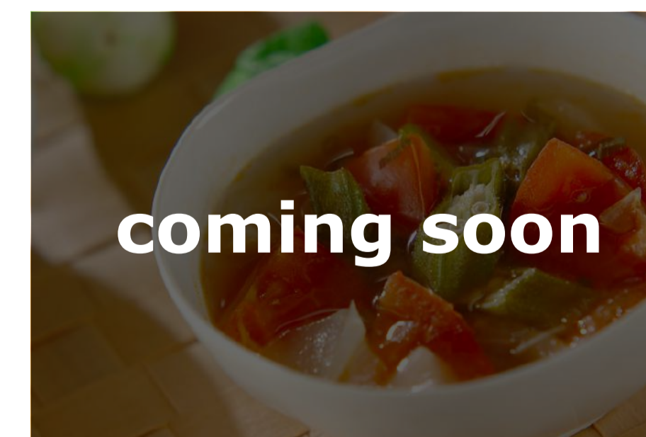
オクラの洋風スープ