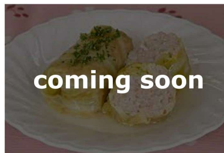
ロールキャベツご飯