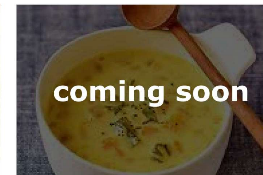
かぼちゃのカレースープ

お問合せ | ☎ 0493-62-2100 (または0493-62-2070) 嵐山ガス株式会社 〒355-0216 埼玉県比企郡嵐山町むさし台1-3-1