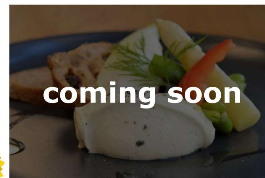
豆腐とクリームチーズのごちそう