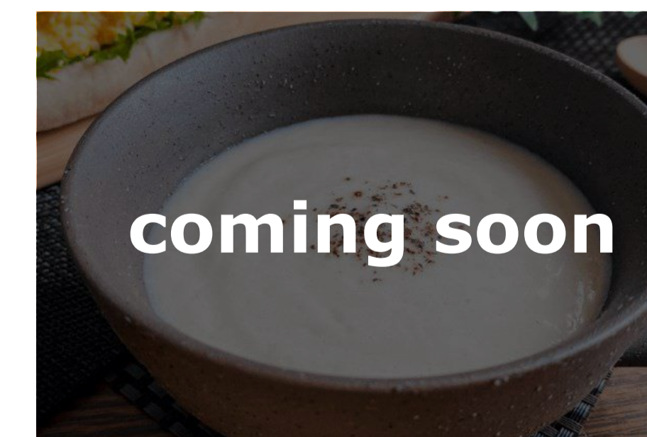
里芋のみそポタージュ

お問合せ | ☎ 0493-62-2100 (または0493-62-2070) 嵐山ガス株式会社 〒355-0216 埼玉県比企郡嵐山町むさし台1-3-1